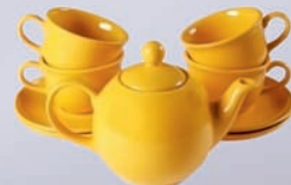
SERWIS OLA 4 OS. / SET