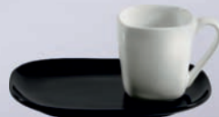
ESPADA / ETNA + SPODEK DUO / + SAUCER DUO