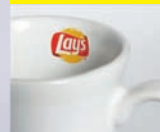
wewnątrz Inside the mug