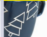
srebro błyszczące Glossy silver