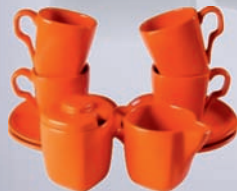
SERWIS ESPADA / SET