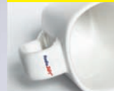
na uchu On the handle