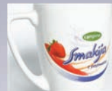
do 50 cm 2 Up to 50 cm 2