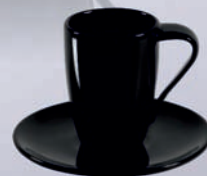
DAKOTA / DESNA + SPODEK /+ SAUCER