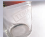
imitujący piaskowanie Sand blasting imitation