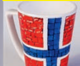
na całej powierzchni kubka On the entire mug surface