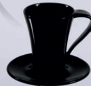
FLORES / FENIKS + SPODEK / + SAUCER