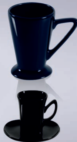
KIM + SPODEK / + SAUCER