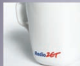
do 20 cm 2 Up to 20 cm 2