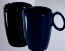
OTTO + PLUS