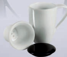
DAKOTA / DESNA + ZAPARZACZ /+ TEA INFUSER