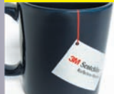
srebro matowe Matte silver