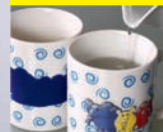
termoczulý Thermo active