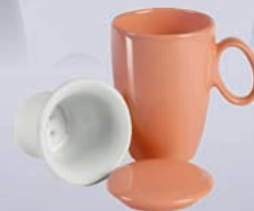
OTTO / OSLO + ZAPARZACZ / - TEA INFUSER