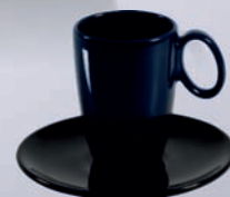
OTTO / OSLO + SPODEK / - SAUCER