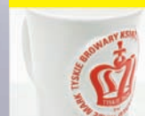
wypukły Embossed imprint