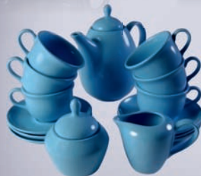
SERWIS OLA 6 OS. / SET