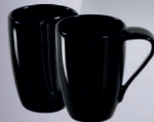
DAKOTA + PLUS