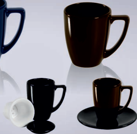
EDEN / ELAN + ZAPARZACZ / + TEA INFUSER