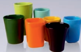
KUBKI BEZ UCHA