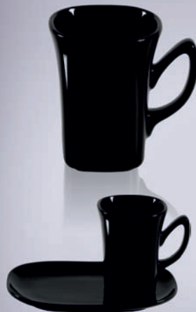
KIM + SPODEK DUO / + SAUCER DUO