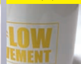
złoto matowe Matte gold