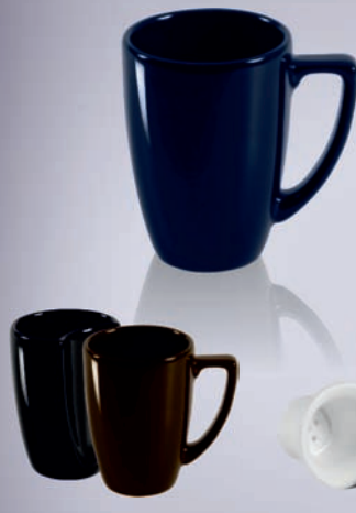
EDEN + PLUS