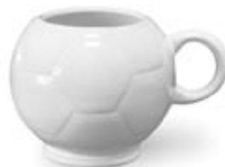
PILKA ☐ 320ml

dostępna kolorystyka, strona 15 | available colours, page 15