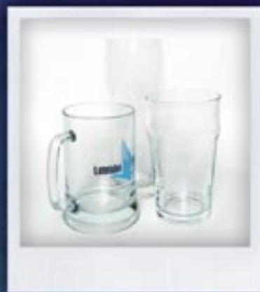
KUFLE I SZKLANKI DO PIWA kilkadziesiąt wzorów do wyboru BEER MUGS AND GLASSES several dozen designs to select from