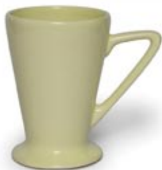
MARTIN ☐ 220ml