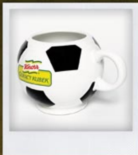
KUBKI W DOWOLNYM KSZTAŁCIE