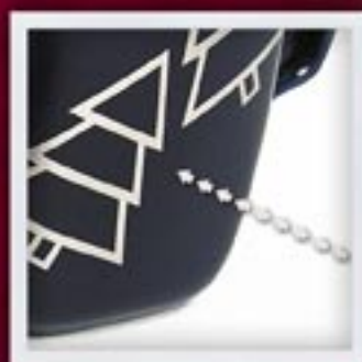
SREBRO BŁYSZCZĄCE | PLATYNA SHINY SILVER | PLATINUM