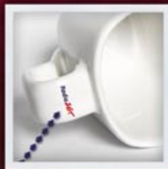
NA UCHU ON THE HANDLE