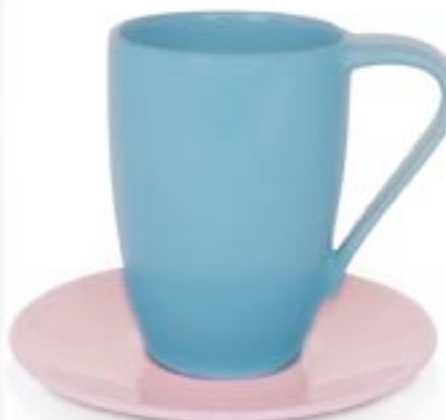
DAKOTA + SPODEK