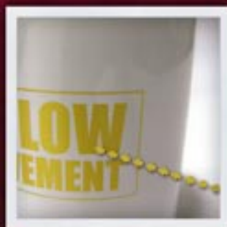
ZŁOTO MATOWE MATTE GOLD