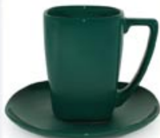
SANTO + SPODEK ESPADA ☞ 240ml