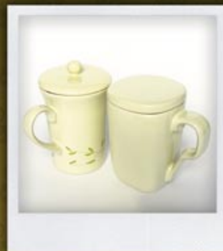
KUBKI Z POKRYWKAMI