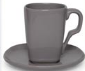
FARD + SPODEK ESPADA ☞ 240ml