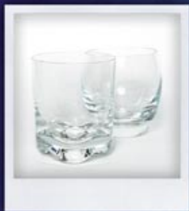
SZKLANKI kilkaset wzorów do wyboru GLASSES several hundred designs to select from