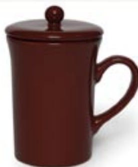
KLARA Z POKRYWKA ☐ 220ml