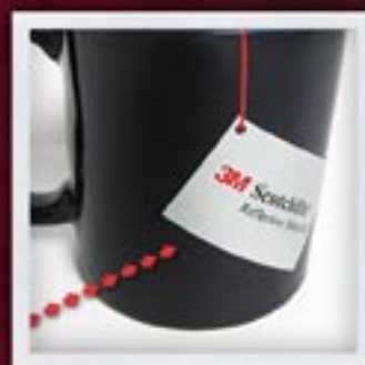
SREBRO MATOWE MATTE SILVER