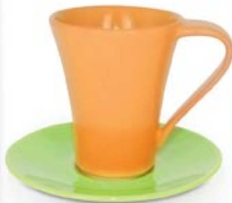
FENIKS + SPODEK