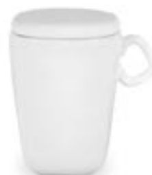
HUGO + POKRYWKA