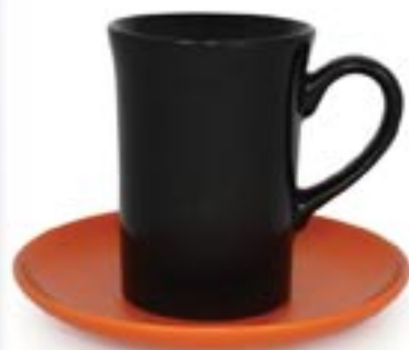
KLARA+SPODEK ☐ 220ml