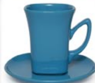
KIM + SPODEK ESPADA ☞ 230ml