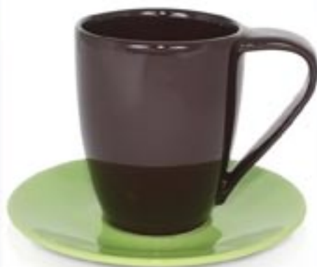
DESNA + SPODEK