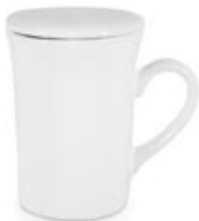
KLARA Z POKRYWKA ☐ 220ml