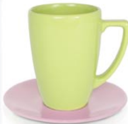
EDEN + SPODEK