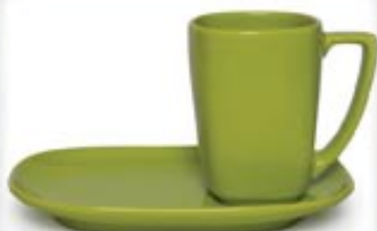
SANTO + SPODEK DUO