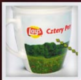
NA CAŁEJ POWIERZCHNI KUBKA TAPETA ON THE ENTIRE MUG SURFACE | OVERPRINT