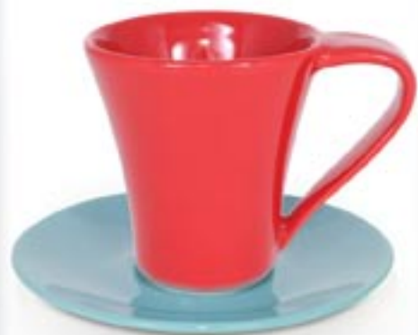
FLORES + SPODEK