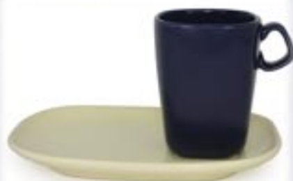
HUGO + SPODEK DUO