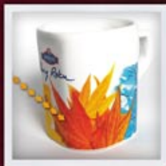
TAPETA NIEPEŁNA INCOMPLETE OVERPRINT