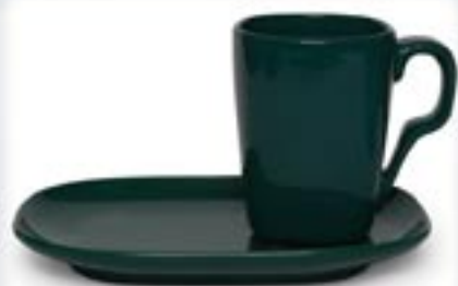
FARD + SPODEK DUO