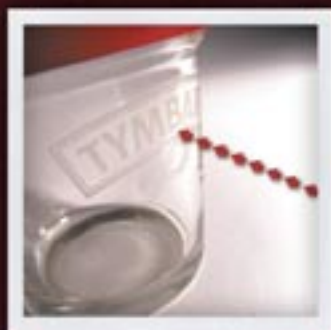
IMITUJĄCY PIASKOWANIE SAND-BLASTING IMITATION