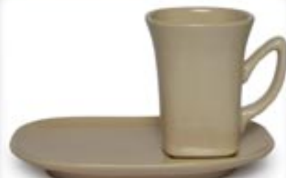
KIM + SPODEK DUO