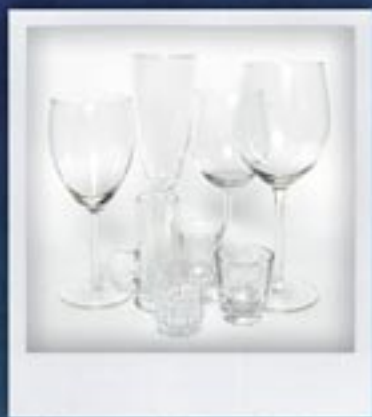
KIELISZKI kilkaset wzorów do wyboru GLASSES several hundred designs to select from