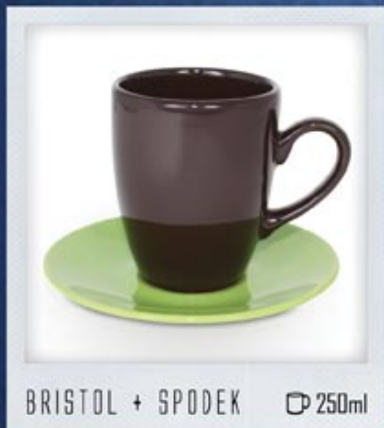
BRISTOL + SPODEK