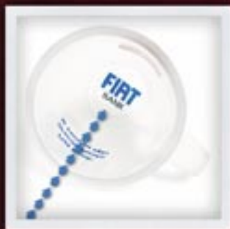
NA DENKU | WEWNĄTRZ ON THE BOTTOM | INSIDE