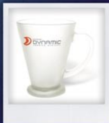
KUBKI SZRONIONE | istnieje możliwość barwienia kubków na dowolny kolor FROSTED CUPS | it is possible to colour the cups in any colour