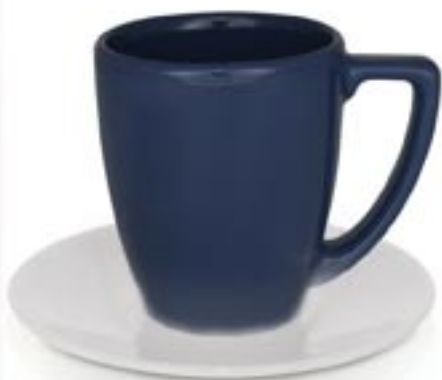
ELAN + SPODEK