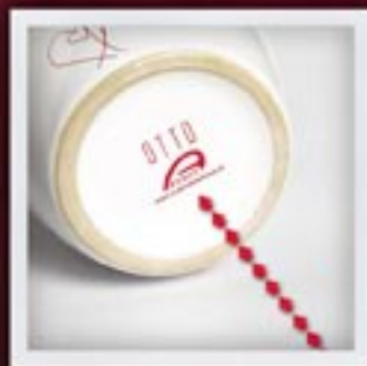
NA DENKU | NA ZEWNĄTRZ ON THE BOTTOM | OUTSIDE