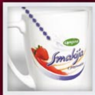
JEDNOSTRONNY LUB DWUSTRONNY do 26 cm 2 ONE- OR TWO-SIDED, up to 26 cm 2