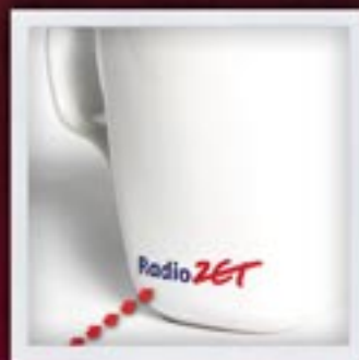
MAŁY, JEDNOSTRONNY do 20 cm 2 SMALL, ONE-SIDED, up to 20 cm 2