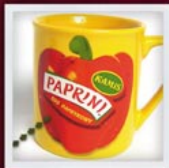
JEDNOSTRONNY LUB DWUSTRONNY do 60 cm 2 ONE- OR TWO-SIDED, up to 60 cm 2