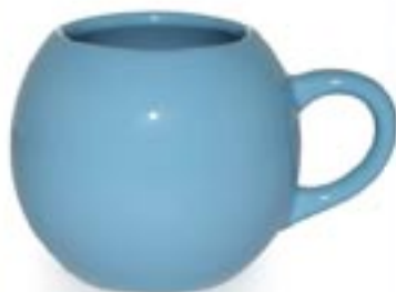
POLO ☐ 420ml