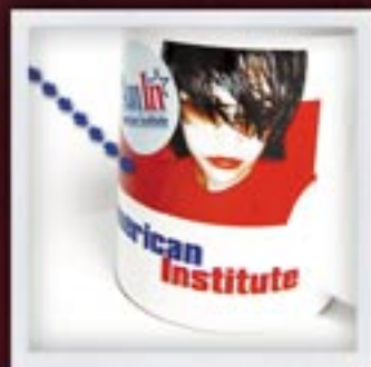
TRIADOWY | CMYK TRIAD | CMYK