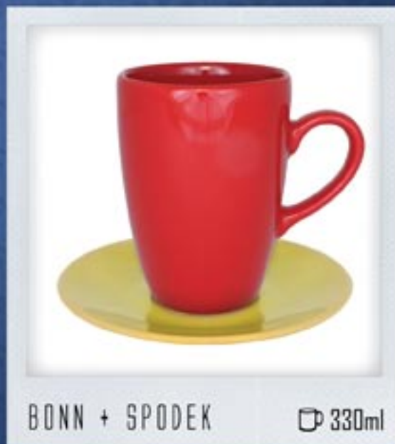
BONN + SPODEK