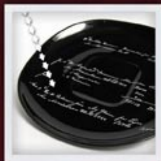
NA SPODKU ON THE SAUCER